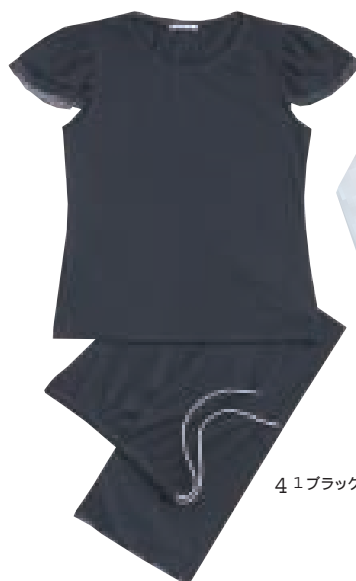
4 1 ブラック

袖のメッシュ使いや7分袖のバランスがとってもおしゃれなホームウェア。こんなに大人テイストのホームウェアって他にはないはず。