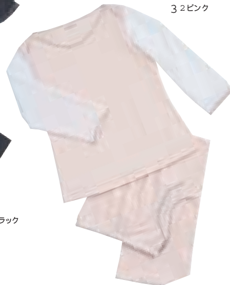
3 2 ピンク