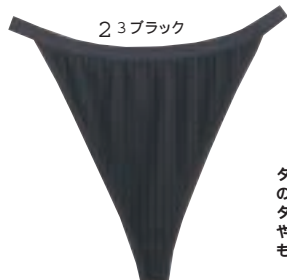
2 3 ブラック

シンシアらしいカラー使いがオシャレなシンプルな三角ブラ。ノンワイヤーなので、リラックスしたい時に最適。胸のダーツで着用時の立体感とフィット感をサポートしています。