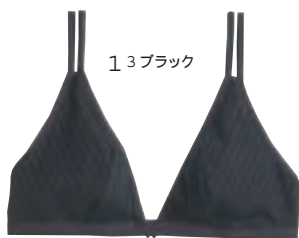
1 3 ブラック

タンガ初心者にもはきやすい独自のシルエット。フロントには二重の当て布がついて安心。バックスタイル